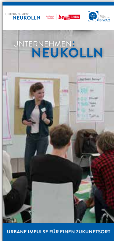
URBANE IMPULSE FÜR EINEN ZUKUNFTSORT